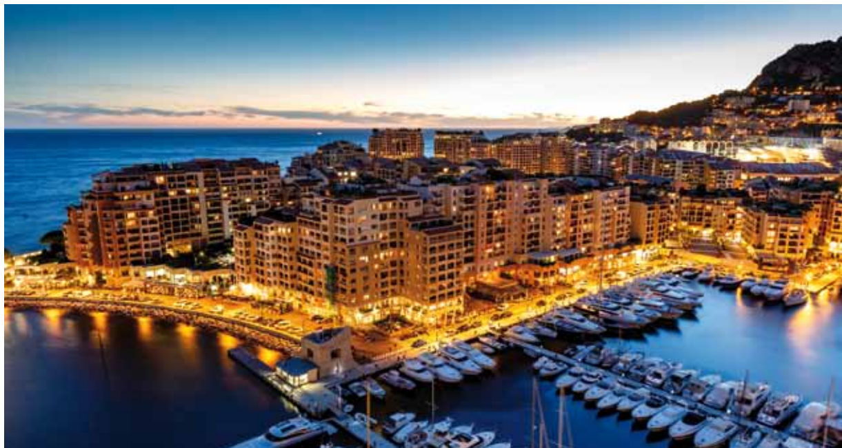
Le quartier de Fontvieille où se situe le siège de la Société Monégasque de l'Électricité et du Gaz.

Dans le cadre du Plan Énergie Climat engagé par la Principauté de Monaco, le 12 janvier avait lieu la présentation du programme Data +. Cette mission a été confiée par le Gouvernement Princier à la Société Monégasque de l'Électricité et du Gaz (SMEG). Le JDA s'est entretenu avec le Conseiller de Gouvernement pour l'Équipement, l'Environnement et de l'Urbanisme pour vous donner des éléments de réponse.