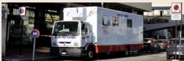
Les Unités Mobiles de Prélèvement (UMP) ont été mises en place dans les années 80. Ce mode de collecte a toujours existé, depuis la création des centres de transfusion. Son avantage est de venir « au plus près » des donneurs de sang.

Enfin, le CTS se charge des actions de formation liée à la sécurité transfusionnelle.