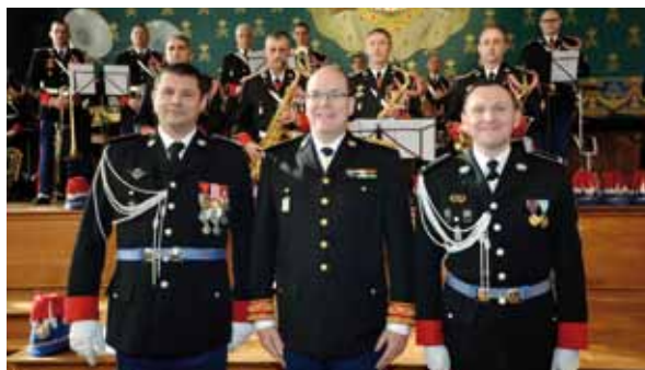
On comptait au total 250 invités présents lors de cette célébration. Parmi eux, Monsieur Andréa Casiraghi, la Baronne Elisabeth de Massy et Mademoiselle Mélanie, Antoinette de Massy.

Sapeurs-Pompiers de Monaco, les Carabiniers et leurs familles étaient présents à la célébration.