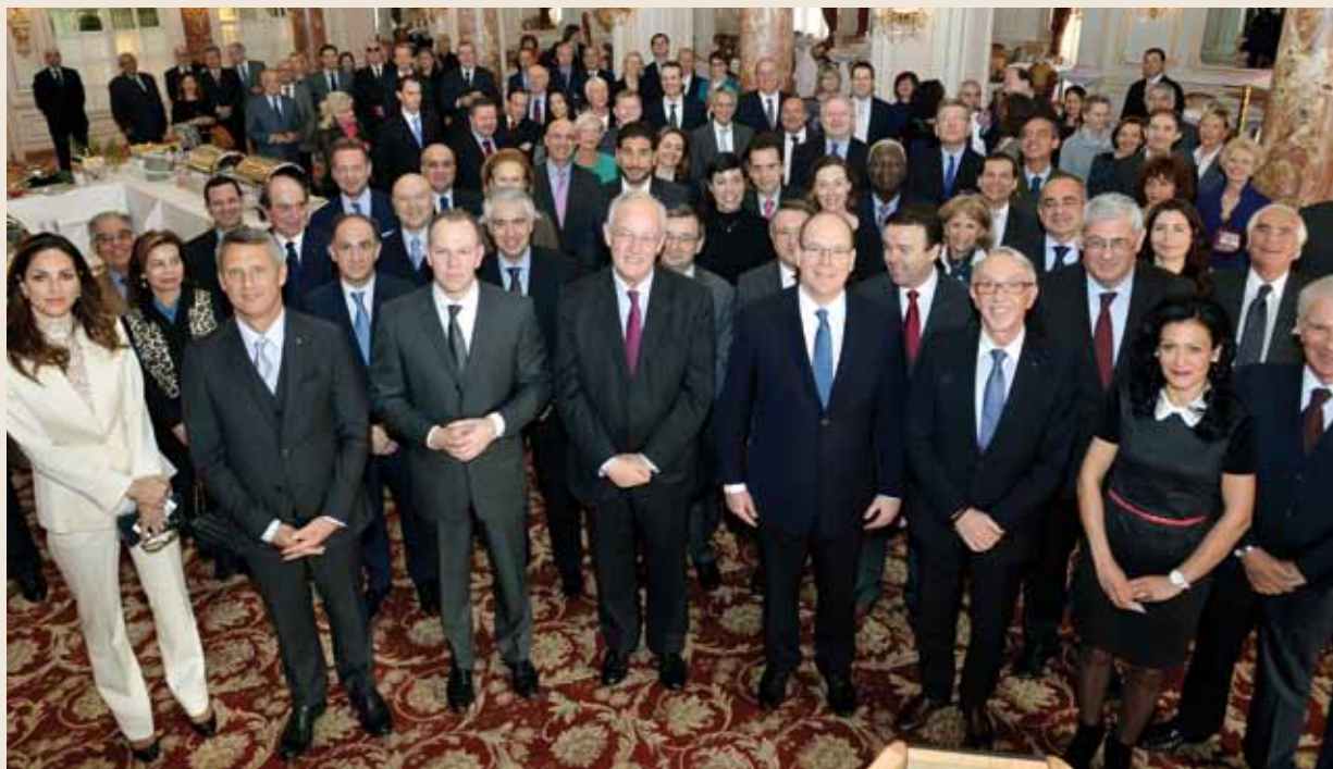
Le Département des Relations Extérieures et de la Coopération a offert une réception à laquelle ont participé de nombreux invités officiels et notamment des anciens collaborateurs du DREC.

À l'occasion de sa traditionnelle réception des Vœux au corps consulaire étranger à Monaco, le Département des Relations Extérieures et de la Coopération a fêté, le 20 janvier dernier, en présence de S.A.S. le Prince Souverain et de S.E. M. le Ministre d'Etat, le dixième anniversaire de sa création.