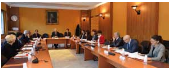
Lors de son intervention, S.E. M.Michel Roger a remercié les membres pour les échanges fructueux au sein de la commission et a rappelé que « l'insertion des jeunes diplômés est au cœur des préoccupations du Gouvernement Princier ».