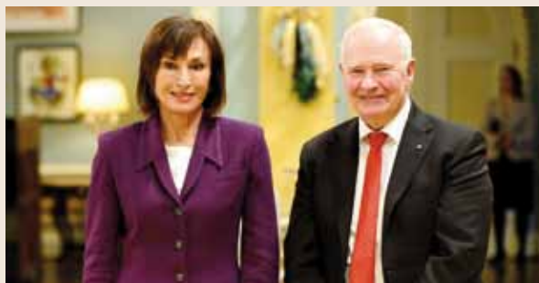
À l'issue de la cérémonie officielle, l'Ambassadeur a pu s'entretenir avec le Gouverneur Général et évoquer plusieurs domaines possibles de collaboration, notamment en matière d'éducation, d'environnement et d'aides aux populations les plus démunies.

Il a tenu à souligner que la Principauté de Monaco et le Canada sont fiers de collaborer étroitement au sein d'organisations telles que les Nations Unies ou la Francophonie.