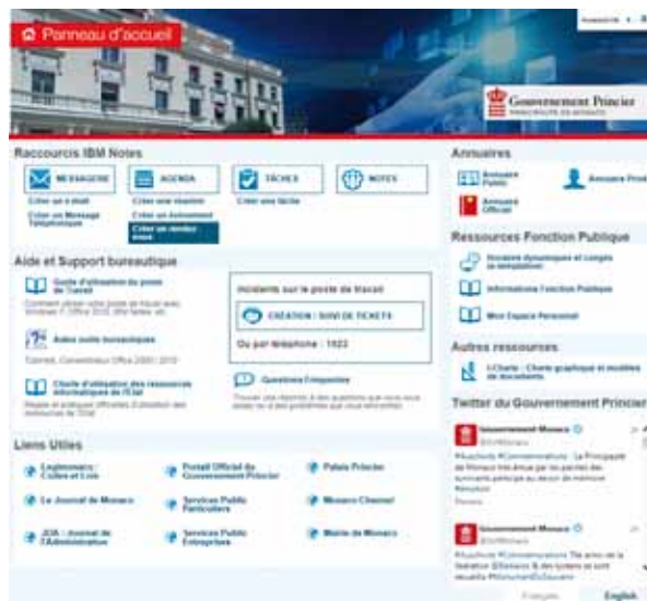
Le nouvel écran d'accueil de l'Administration servira de point d'accès pour les différents logiciels. La navigation a été revue afin d'apporter plus d'ergonomie pour répondre aux besoins de l'ensemble des utilisateurs des services de l'Administration monégasque.

« spécifiques », contre 40W pour les postes actuels). Ces postes dits « spécifiques » disposent de capacités étendues pour les services dont les missions nécessitent ce type de matériel (comme par exemple ceux qui sont utilisés à l'IMSEE).