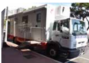
DASS - Le Centre de Transfusion Sanguine