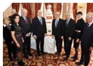
DREC - Les 10 ans du Département