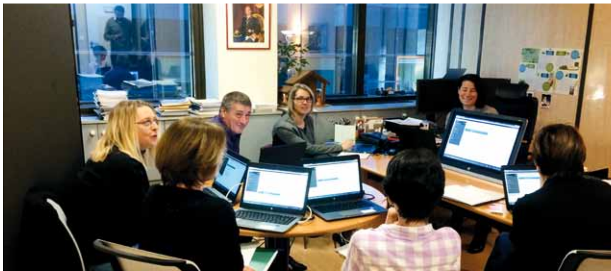
Comme ici à l'Administration des Domaines, les formations aux nouveaux postes informatiques sont en cours dans l'ensemble des services.

Au mois de janvier 2015, l'Administration monégasque a franchi un nouveau cap en initiant le déploiement de nouveaux postes informatiques plus performants pour ses services.