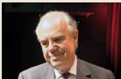
Frédéric Mitterrand sur la scène du Théâtre des Variétés

12 janvier 2015 : la Fondation Prince Pierre a reçu Frédéric Mitterrand lors d'une conférence aux Théâtre des Variétés. Celui qui fut Ministre français de la Culture y a présenté son dernier livre « La Récréation ». Frédéric Mitterrand s'est volontiers livré au jeu des questions et des réponses avec à le public.