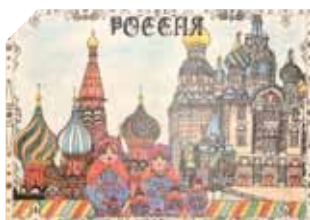
INTÉRIEUR - Carte de vœux de la DENJS, hommage à la culture russe