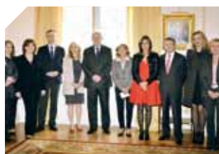
ME - Le SCADA et la 4 e réunion de la Commission Consultative des Archives de l'Etat

LL.AA.SS. le Prince Albert II et la Princesse Charlène ont présenté Leurs enfants, le Prince Héritaire Jacques et la Princesse Gabriella aux Monégasques, aux résidents ainsi qu'à tous les amis de la Principauté. Le Gouvernement Princier adresse ses plus sincères félicitations au Couple Princier et s'associe à Leur joie.