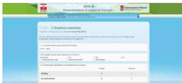
Le questionnaire est accessible par Internet. Il sera protégé par un identifiant personnel et un code d'accès. Ces restitutions garantiront l'anonymat, le respect du secret statistique et de la protection des données nominatives.

A cette fin, le Gouvernement a confié à la SMEG la réalisation de cette collecte d'informations DATA PLUS. Il s'agit de mieux connaître les consommations énergétiques des résidents et professionnels, leurs comportements de consommation, leurs usages des énergies et les équipements utilisant ces énergies.