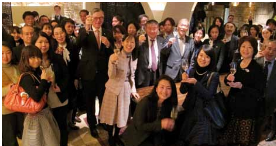
À l'issue de la cérémonie, un toast a été porté à la santé de l'Empereur du Japon, qui fêtera le 23 décembre prochain son 81 e anniversaire. Les invités ont également formulé des vœux de Bonheur et de Prospérité à LL.AA.SS. le Prince Albert II et la Princesse Charlène, ainsi qu'à leurs enfants.

Princesse Charlène, déjà présentée à Tokyo en juillet et à Kyoto en septembre 2014.