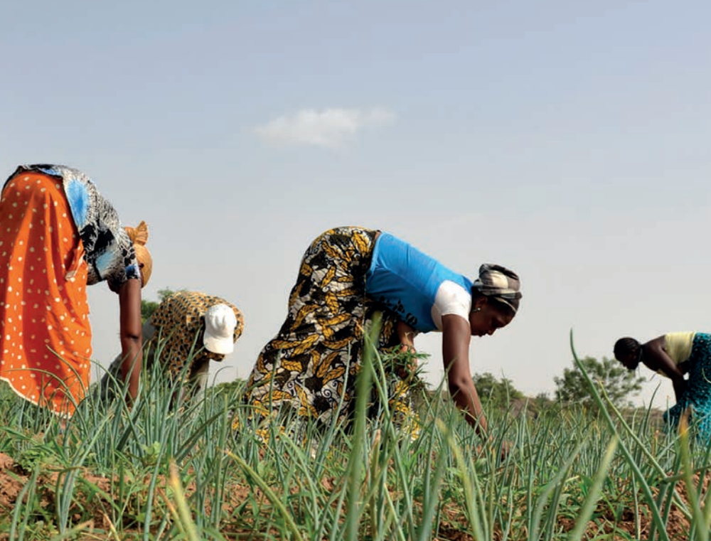
Soutien à l'agriculture familiale au Nord Mali