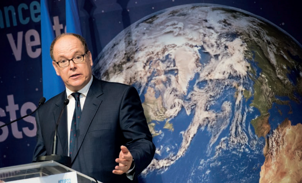
S.A.S. le Prince Albert II de Monaco à la COP 22 (Marrakech, Maroc), 12 novembre 2016