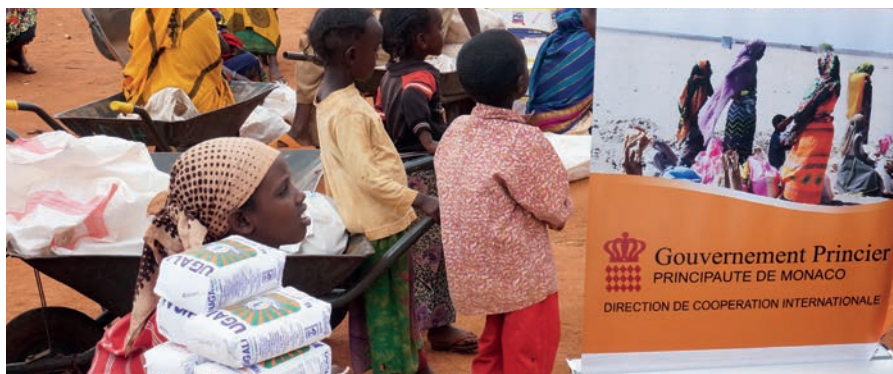
Aide humanitaire d'urgence : distribution alimentaire au Nord Kenya