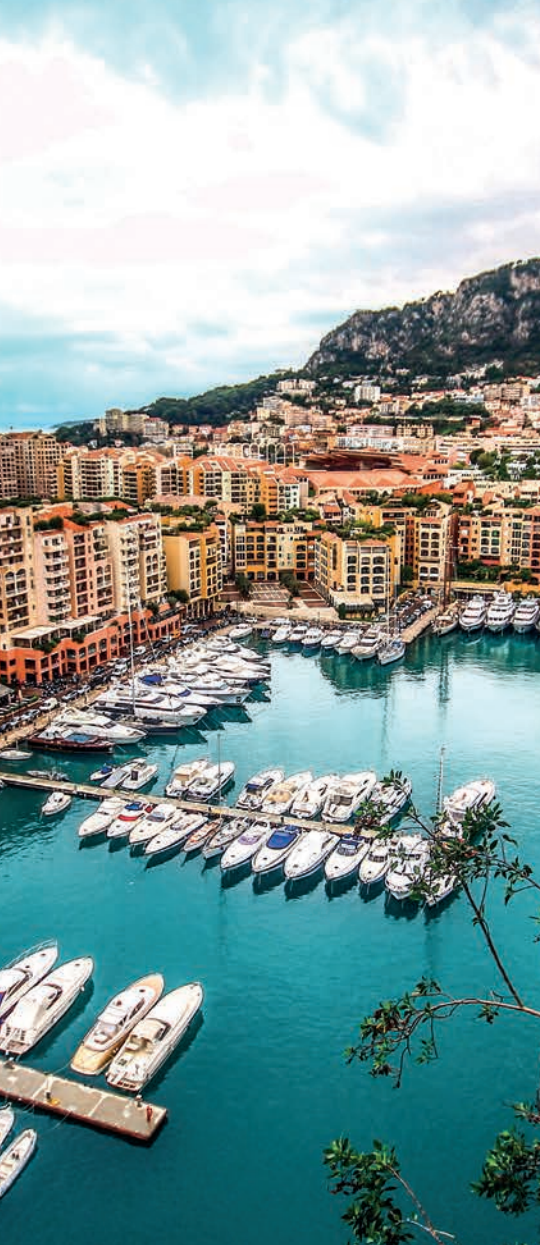
Monaco quartier de Fontvieille