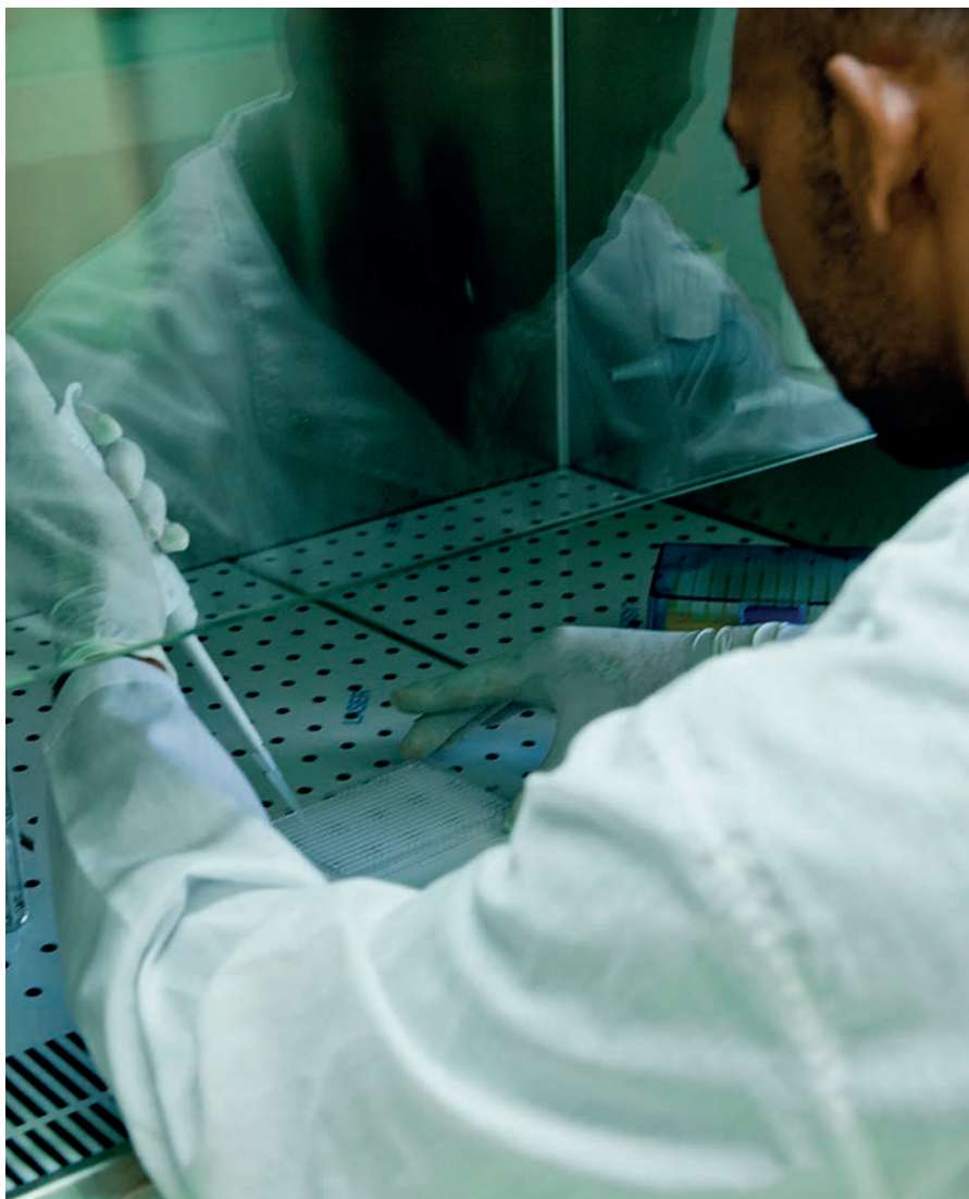
Renforcement des capacités médicales et scientifiques à Madagascar

S oucieuse de promouvoir un développement durable, juste et équilibré pour tous, la Principauté de Monaco consacre des efforts importants à l'Aide Publique au Développement (APD) : en 2020, son soutien financier atteindra plus de 500 euros par habitant. Ces aides ne pèsent pas sur l'endettement des pays en développement et sont totalement indépendantes de tout intérêt économique direct. Tous les projets soutenus le sont par ailleurs en respectant la souveraineté et l'autorité de chaque pays partenaire.