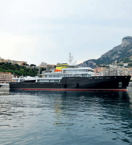
© Direction de la Communication Manuel Vitell