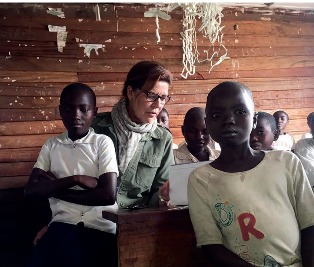
S.A.R. la Princesse Caroline de Monaco, Présidente de l'AMADE Mondiale, camp de déplacés internes de Mungote, Nord-Kivu, République Démocratique du Congo