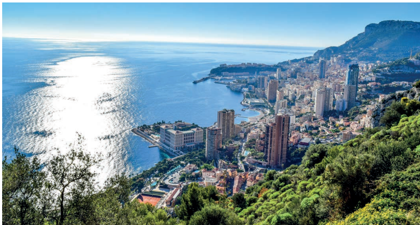
Principauté de Monaco

Un groupe de travail interministériel, placé sous l'autorité du Ministre d'État (Chef de Gouvernement) et piloté par le Département des Relations Extérieures et de la Coopération, a été créé, composé d'un référent de chaque Département ministériel.