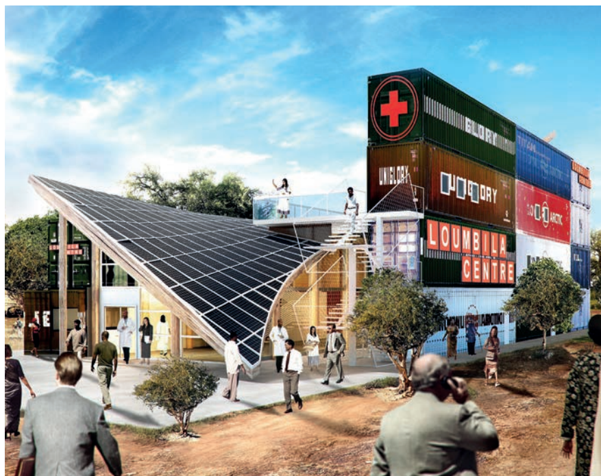
Futur centre de formation professionnelle de Loubila au Burkina Faso.

projet conçu en lien avec la Croix-Rouge Monégasque et la Croix-Rouge Burkinabé. Il inclura aussi un centre de formation à l'hôtellerie et à la restauration pour les jeunes en difficulté, de même qu'un centre d'enseignement au sauvetage aquatique financé par la Fondation Princesse Charlène de Monaco.