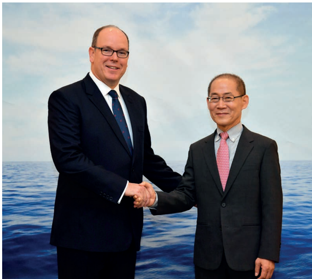
S.A.S. le Prince Albert II et M. Lee Hoesung, Président du GIEC lors de la réunion de cadrage du GIEC sur le rapport spécial « océans et cryosphère » à Monaco, 6 décembre 2016