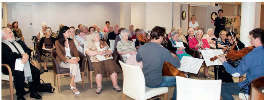
Concert de l'amitié par des musiciens de l'Orchestre Philharmonique de Monte-Carlo à la Résidence de retraite A Qietüdine

Afin de ne laisser personne de côté, les dispositifs d'aide et de soutien médicaux et sociaux agissent en relais, au travers de l'aide médicale de l'État, pour toute personne ne relevant pas d'un régime obligatoire de sécurité sociale et n'étant pas en mesure de souscrire une assurance auprès d'organismes privés. Le dispositif monégasque permet ainsi à l'ensemble de la population d'avoir accès à une couverture maladie.