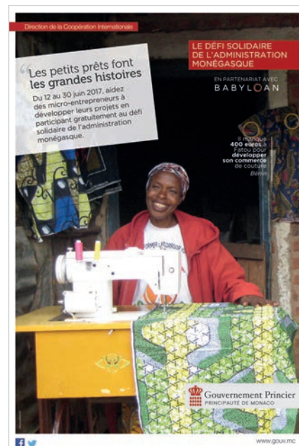
Le défi solidaire de l'Administration monégasque

Pour des raisons qui tiennent à l'histoire et à la géographie, la solidarité avec les pays de la rive Sud de la Méditerranée est particulièrement importante pour la Principauté.