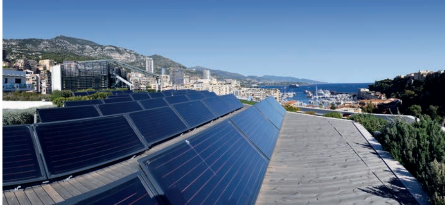
Panneaux solaires sur un immeuble domanial HQE