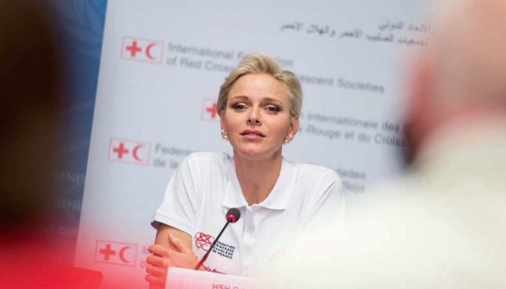
Participation de S.A.S. la Princesse Charlène de Monaco à la Journée mondiale des premiers secours organisée par la Fédération internationale des Sociétés de la Croix-Rouge et du Croissant-Rouge, Genève, Suisse, 9 septembre 2016

Le handicap n'est pas exclusif du bénéfice de cette scolarité de qualité, au contraire. En considération des besoins spécifiques de l'enfant ou du jeune, le Gouvernement Princier met en œuvre les adaptations nécessaires à son instruction en milieu normal ou spécialisé : accompagnement par des enseignants spécialisés ou des auxiliaires de vie scolaire, adaptation du rythme scolaire, des supports, outils informatiques.