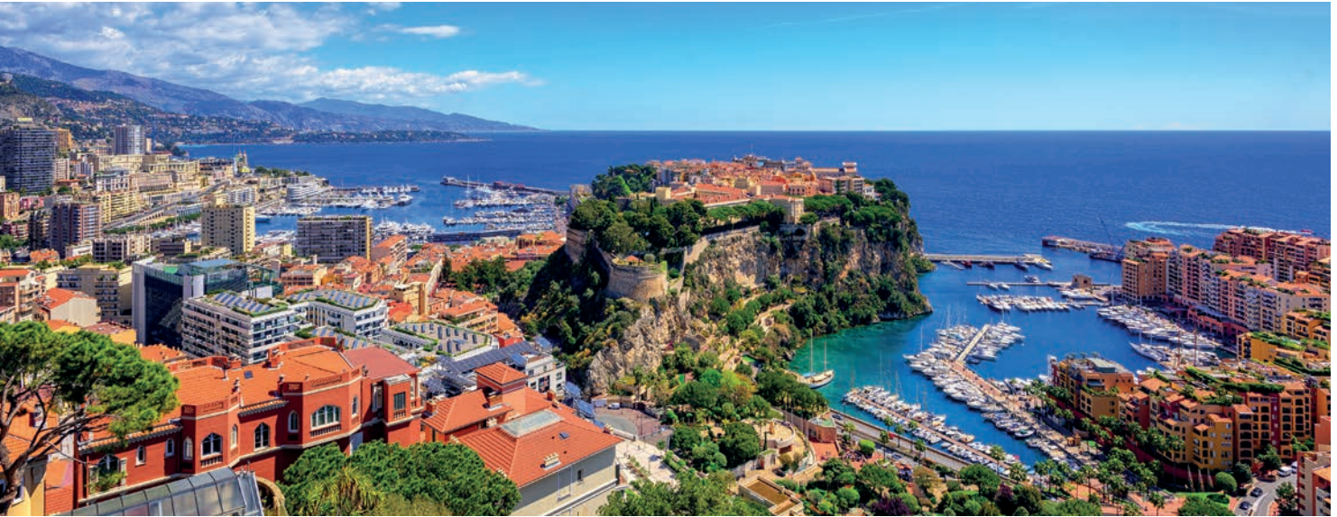
Principauté de Monaco